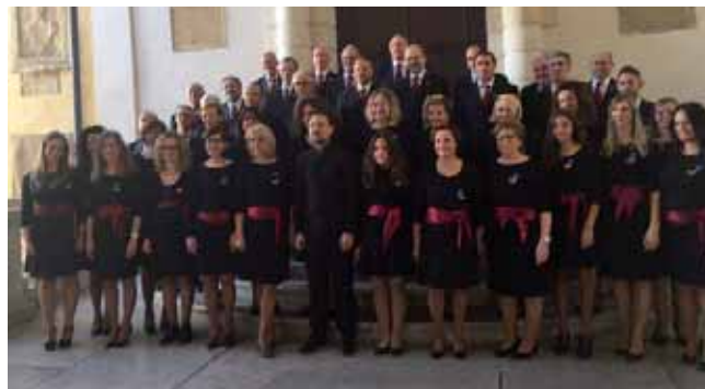
Il coro Luca Lucchesi