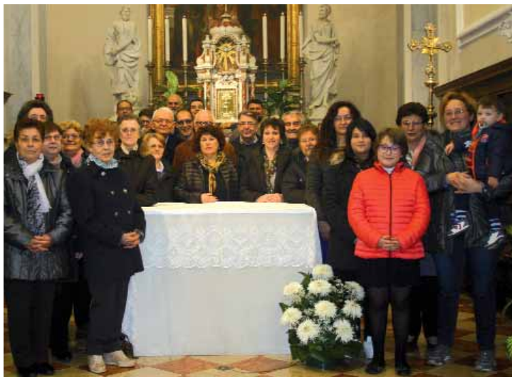
Il coro di Fossalta Maggiore