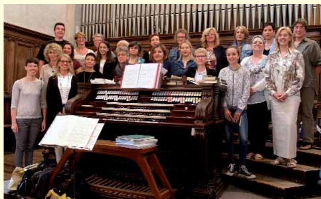
Il coro Voci in... canto

Veglia Pasquale, le Prime Comunioni ed un turno delle Cresime. In occasione del Corpus Domini coordina i coristi dei cori parrocchiali dell'opitergino nell'animazione della Messa che si svolge in Piazza Grande. Nel tempo ha arricchito il proprio repertorio specializzandosi nei canti per la Messa di matrimonio e spesso durante l'anno rende gioiosa la commovente celebrazione che vede l'unione indissolubile dell'uomo e della donna. Il tutto