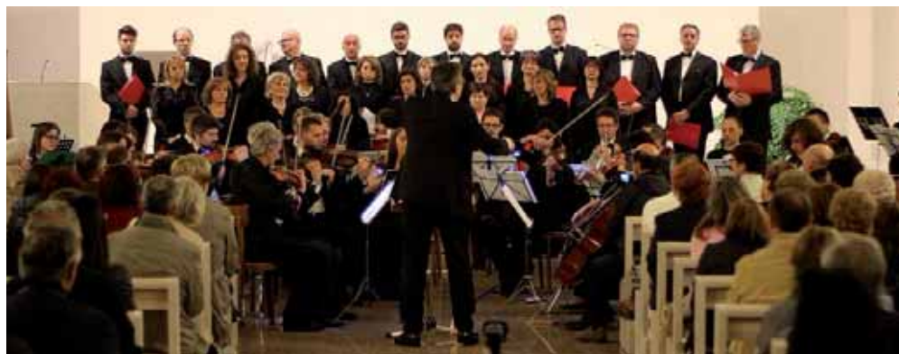
Il coro In musica Gaudium

stra, è una formazione che raccoglie al suo interno studenti, appassionati di musica e musicisti e, peculiarità del gruppo, è la presenza di un coro e di un'orchestra fuse in un'unica entità e complementari l'uno all'altra, caratteristica questa che permette di presentare al pubblico un repertorio prevalentemente incentrato sulla musica corale, soprattutto sacra, con accompagnamento dell'orchestra d'archi oltre che brani per coro a cappella o per sola orchestra. In particolare è importante e bello sapere dell'esistenza nel territorio di un tale complesso, un gruppo di circa trenta coristi, alcuni dei quali studenti di canto in grado di ricoprire anche i ruoli solistici, e di un'orchestra d'archi i cui componenti provengono non solo dall'opitergino-mottense, ma anche da diverse zone del trevigiano, del veneziano e del pordenonese. L'attività del