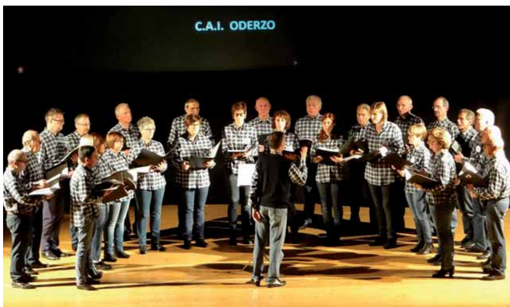
Il Coro Alpes