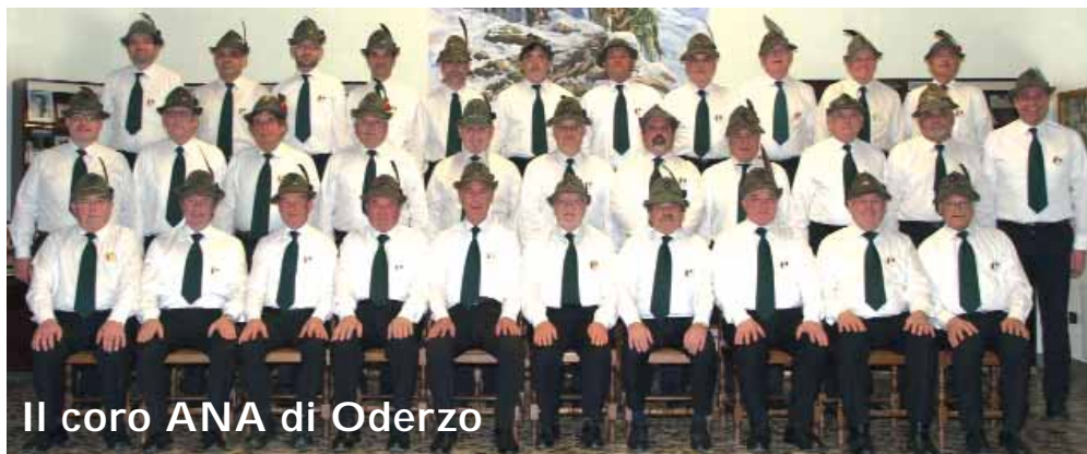
Il coro ANA di Oderzo