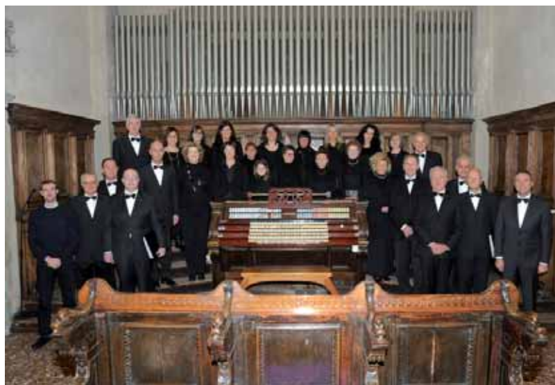
La Schola Cantorum