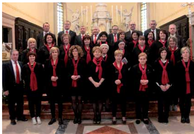
La Corale di San Mansueto